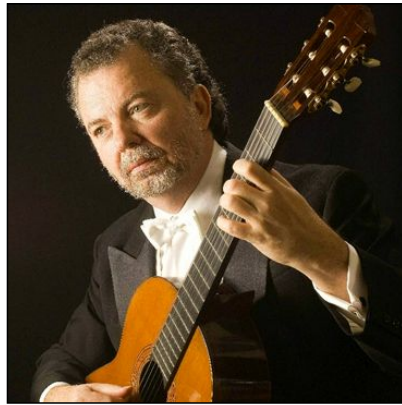
Manuel Barrueco

Los guitarristas asistentes podrán participar también en las clases magistrales, seminarios, el Guitar Camp (para guitarristas principiantes y de nivel medio), los talleres brasileños para guitarra y percusión, los seminarios o el proyecto Nordic Guitar Project (para guitarristas de Suecia, Dinamarca, Noruega e Islandia). Durante el festival se formará también una orquesta de guitarras que interpretará la obra Folguedo de Celso Machado; los ensayos serán