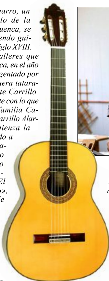
Guitarra de concierto Gabriela