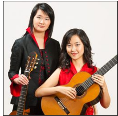
Beijing Guitar Duo

Los días 15 y 16, en el Tampere Hall, tendrá lugar el Tampere Guitar Show, en el que participarán luthiers de todas partes del mundo, y donde también se podrán encontrar partituras, CDs y toda clase de accesorios