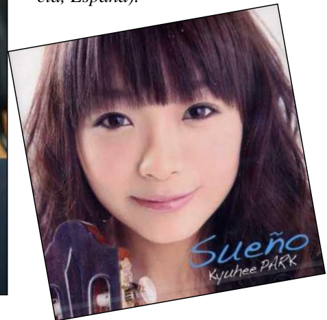
Sueño, CD editado en Japón en el año 2010. Abajo a la izquierda, portada de la revista japonesa Gendai Guitar Magazine de octubre de 2009

2007, primer premio y premio del público en el Concurso Internacional de Guitarra de Heinsberg (Alemania). En 2008, primer premio en el Concurso Internacional «Printemps de la Guitare» (Bélgica). Y en el 2009, primer premio en el Concurso Internacional de Guitarra de Ligita (Liechtenstein), segundo premio en el Concurso Internacional de Guitarra Michele Pittaluga (Italia) y primer premio en el Concurso Internacional de Guitarra Luys Milán (Ontinyent, Valencia, España).